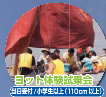
ヨット体験試乗会 当日受付/小学生以上(110cm以上)