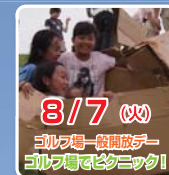
8/7 (火) ゴルフ場一般開放デー ゴルフ場でピクニック！

若洲海浜公園 SEA-FRONT MUSEUM シーフロントミュージアム公式ブログ http://sea-front.seesaa.net/