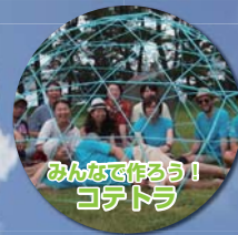
みんなで作ろう！ コテトラ