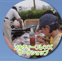
ソルティーフレンズ ワークショップ