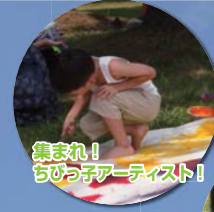
集まれ！ ちびっこアーティスト！