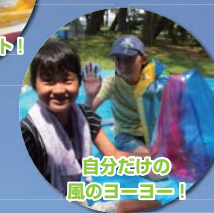
自分だけの 風のヨーヨー！